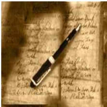
Eén van de dagboeken

“Het is een gemalen plant van een tropische boom uit Kapoutopakili ergens in de buurt van Samoa” Om niet dom te lijken vroeg ik niet waar dat lag.