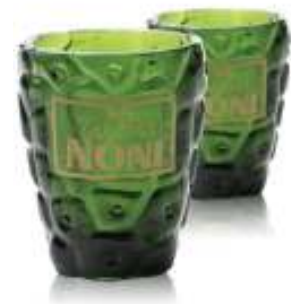
De speciale Noniglazen

Wijkerheld Bisdom. Toch jammer dat die grotendeels verloren zijn gegaan. Omdat ik niet meer zo veel kan reizen, omring ik mij de laatste jaren hier thuis met een stukje Pacific, zoals u ziet, met allerlei gebruiksvoorwerpen, voedsel, muziek en dergelijke uit die gebieden. Vier jaar geleden nam ik eerst Mani mee uit Tahiti. We vonden elkaar wel aardig. Toch bleek ze zich wat eenzaam te voelen in het vreemde Bongeveen, dat kunt u zich voorstellen”