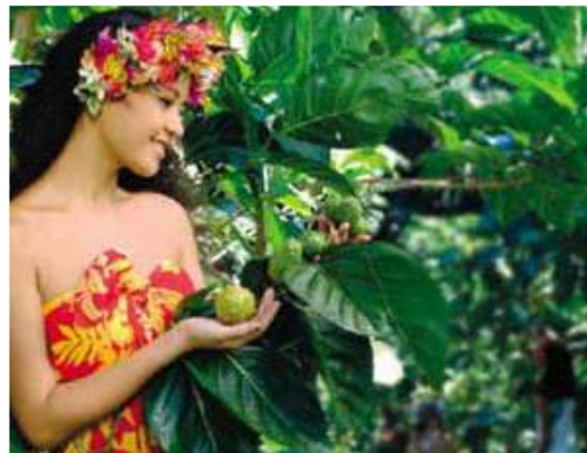
Mani uit Tahiti bij de Noni-moerbeiboom

De professor stond op “Iets drinken?” vroeg