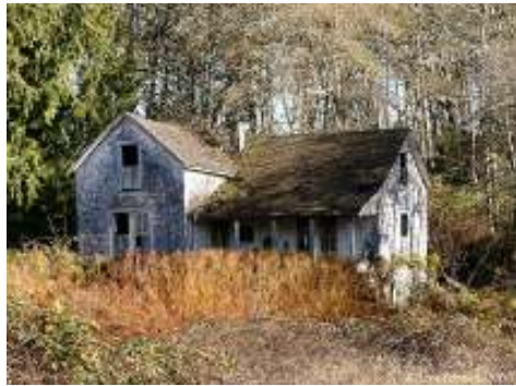
Het inmiddels vervallen huisje van Wijckerheld Bisdom

“De twee oud-soldaten hebben de schat uiteindelijk gevonden, na veel ontberingen en bijna platzak. Sieuwert, de metgezel van Wijckerheld werd tijdens de zoektocht ernstig ziek, waarschijnlijk als gevolg van een muggensteek in de oerwouden van Celebes. Uiteindelijk