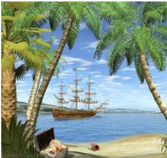
Manihiki, “Eiland van de Zwarte Parel”

“U heeft hier vragen over? ”vroeg de professor terwijl hij mijn blik naar buiten volgde en zonder dat ik antwoord gaf, ging hij verder: “De laatste jaren gaat het reizen niet meer zo vlot. Ondanks de vele noni die ik drink, merk ik toch dat ik ouder wordt. Maar ik kan het reizen eigenlijk nog niet missen. Een soort heimwee, begrijpt u? Vooral de gebieden van de Pacific mis ik elke dag. Daarom voelde ik mij ook zo aangesproken door de reisverhalen van